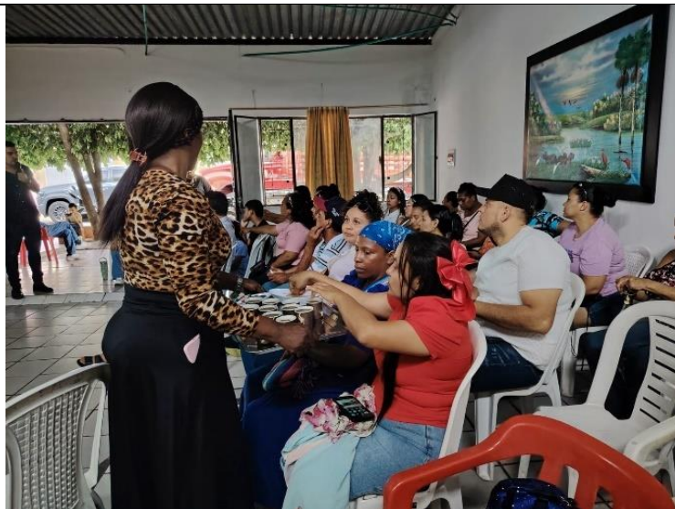
Imagen 8. La dinamizadora, brindó apoyo en la distribución de los refrigerios a los asistentes a la reunión.