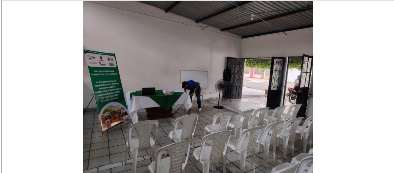
Imagen No. 6: El coordinador del proyecto, gestionó un lugar apto para la realización de la reunión de socialización del cronograma de actividades del proyecto