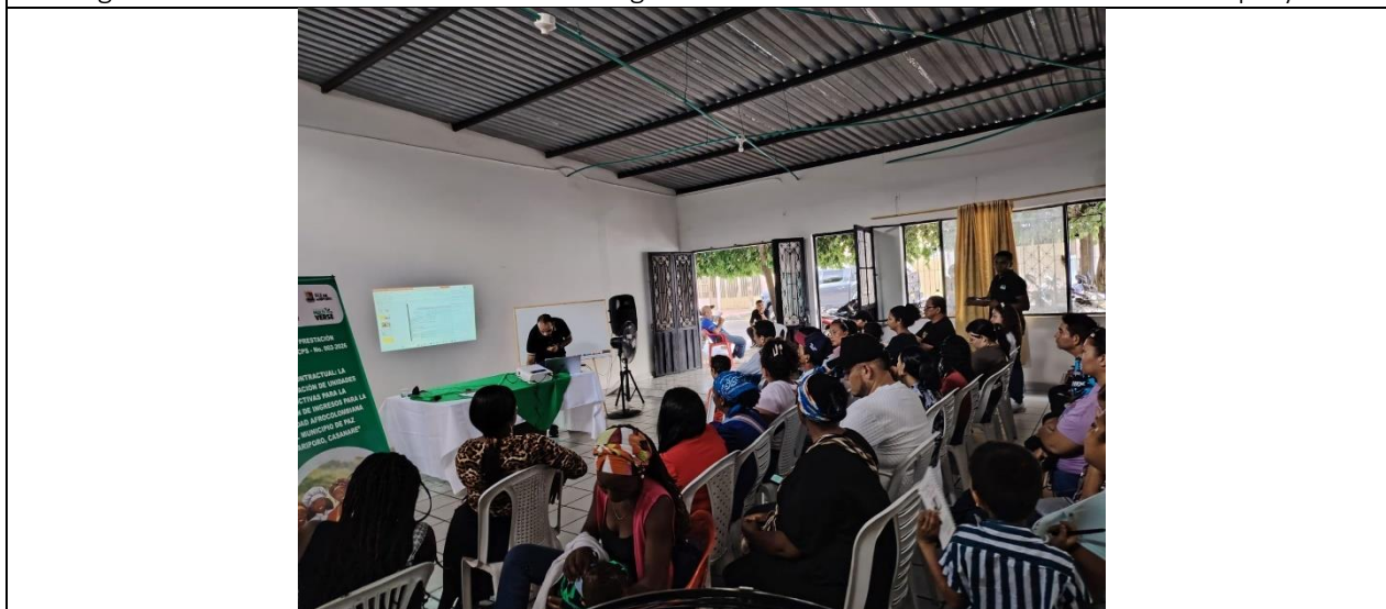
Imagen 2. Participación activa de los beneficiarios en la concertación de horarios del cronograma de actividades