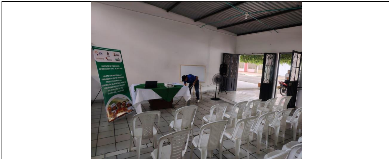
Imagen 3. Se contó con un salón con capacidad para 30 personas, con el fin de desarrollar la reunión de socialización con los 20 beneficiarios del proyecto