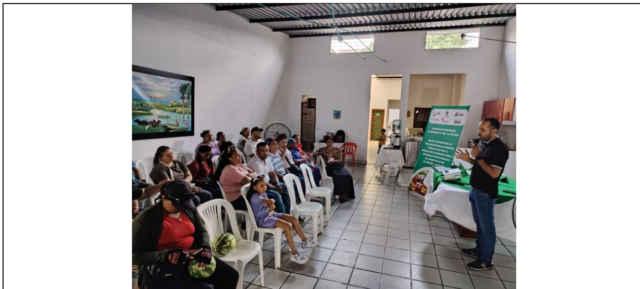
Imagen 1. Reunión de socialización del cronograma de actividades a los 20 beneficiarios del proyecto